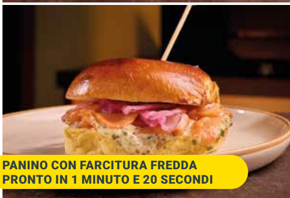
PANINO CON FARCITURA FREDDA PRONTO IN 1 MINUTO E 20 SECONDI