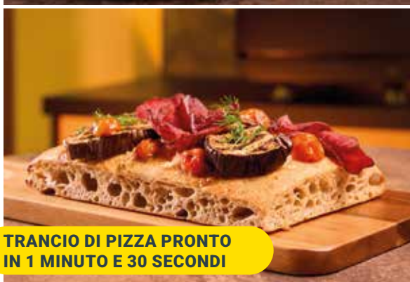
TRANCIO DI PIZZA PRONTO IN 1 MINUTO E 30 SECONDI