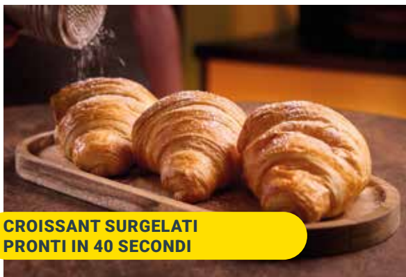
CROISSANT SURGELATI PRONTI IN 40 SECONDI