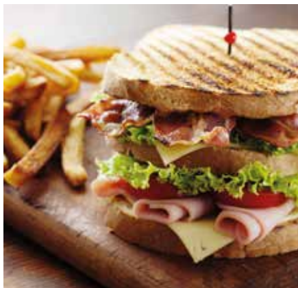
PUB E LOCALI

Opzioni illimitate per ogni tipo di attività di ristorazione.