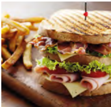
PUB & BAR

Opzioni illimitate per ogni tipo di attività di ristorazione.